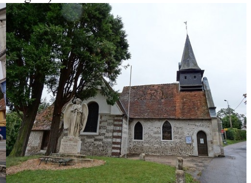
Les abords du monument