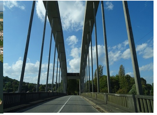
Vue du monument